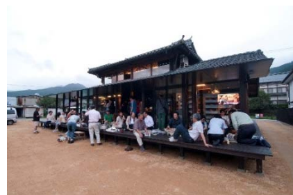
(えんがわオフィスでの地域住民交流会)